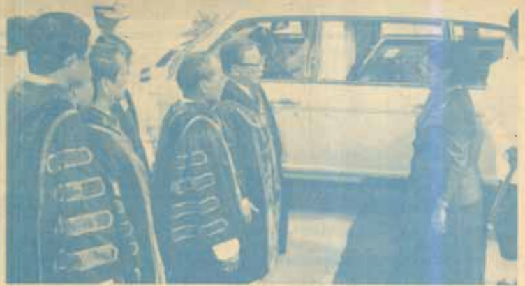
สมเด็จพระเทพรัตนราชสุดาฯ สยามบรมราชกุมารี เสด็จพระราชดำเนินแทนพระองค์ พระราชทานปริญญาบัตร แก่ผู้สำเร็จการศึกษาจากมหาวิทยาลัยรามคำแหง รุ่นที่ 20 ประจำปีการศึกษา 2536 ณ อาคารใหม่ สวนอัมพร ระหว่างวันที่ 2-8 มกราคม 2538

ตามที่รัฐบาลฝรั่งเศสได้ให้ความช่วยเหลือแก่ภาควิชา (อ่านต่อหน้า 11)