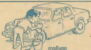
การล้างรถ

น้ำที่จะใช้ควรนำมาใส่ถัง แล้วใช้ ผ้าชุบน้ำมาถูรถ ซึ่งจะใช้ผ้า ประมาณ 2 ก้อน ไม่ควรใช้สายยาง ฉีดล้างโดยตรง