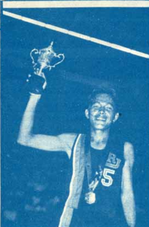
ทีมบาสเก็ตบอลชาย ม.ร. ครองถ้วยชนะเลิศ