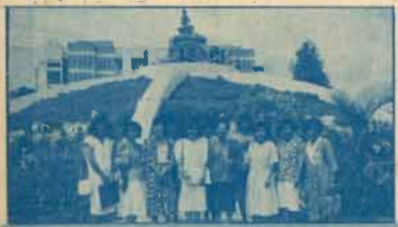
บรรพทิศ คณะมนุษยศาสตร์ ม.ร. เชิญ ศาสตราจารย์เพ็ญศรี คุ้ม มาบรรยายพิเศษ เรื่อง "แนวทางการจัดหลักสูตรไทยศึกษาในระดับมหาลัย" เมื่อวันที่ 29 กุมภาพันธ์ 2531 ณ ห้องประชุมใต้พระรูปพญา