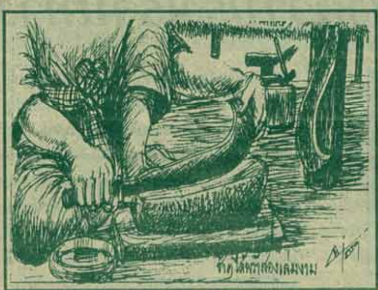
คำ - รศ.นรินทร์ บุญชู