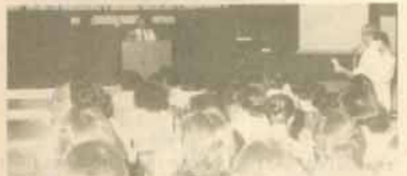
อบรม สำนักบริการทางวิชาการและทดสอบประเมินผล (สวป.) จัดอบรมและเสนอผลงาน คิวซี เรื่อง "คิวซี ช่วยพัฒนาระบบงานบริการนักศึกษาในมหาวิทยาลัย" เมื่อวันที่ 15 กรกฎาคม 2528 ณ ห้องประชุม สวป. ชั้น 5