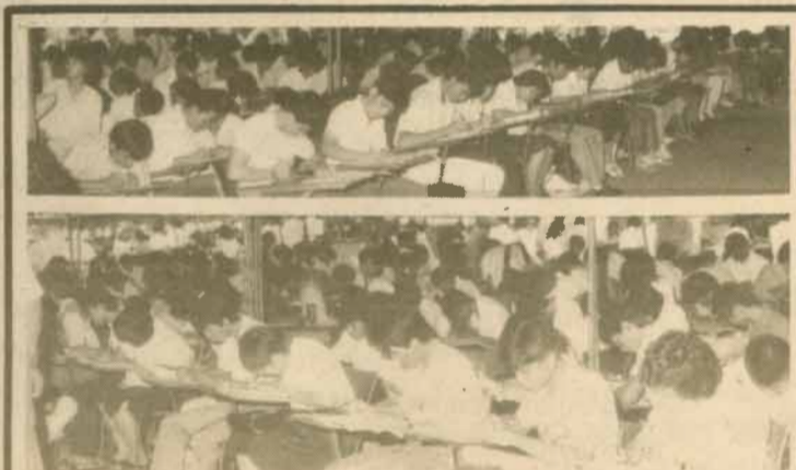
ลงทะเบียน มหาวิทยาลัยเปิดดำเนินการลงทะเบียนเรียน ภาค 1/2528 ของนักศึกษาเก่าและนักศึกษาใหม่ ประเภทสมัครทางไปรษณีย์ ที่รามคำแหง 1 ตั้งแต่วันที่ 23 กรกฎาคม 2528-8 สิงหาคม 2528