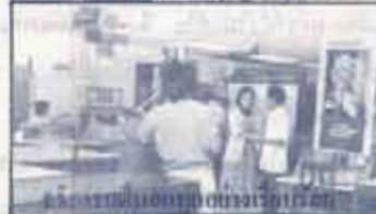
กรรมการประจำห้องเรียนตรวจ

06.45 น. วันที่ 11 ก.พ. 26 นำข้อมูล ไปอ่านคะแนนที่ศูนย์คอมพิวเตอร์ การไฟฟ้าส่วนภูมิภาค