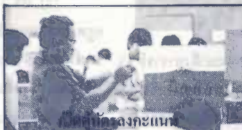
นักศึกษาตรวจสอบคะแนน