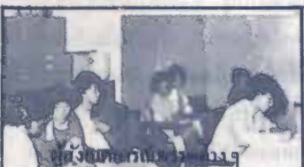
ผู้ช่วยคณบดีตรวจคะแนน

17.30 น. เมื่อวันที่ 10 ก.พ. 26 ณ ห้องคอมพิวเตอร์ อาคาร สว.ชั้น 4 ใน ช่วงเวลาของการตรวจนับคะแนนการ เลือกตั้งองค์การนักศึกษาและสภานักศึกษา