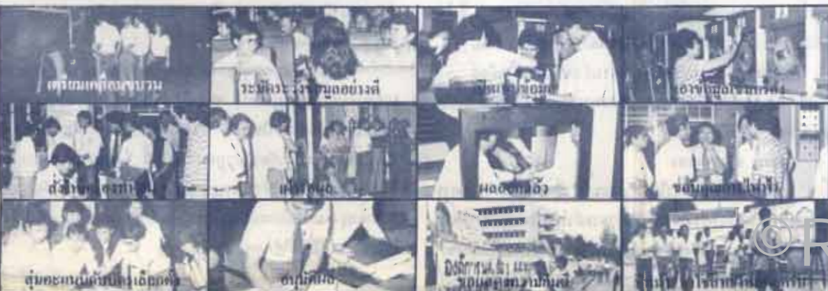
เตรียมการก่อนขบวน

06.45 น. วันที่ 11 ก.พ. 26 นำข้อมูล ไปอ่านคะแนนที่ศูนย์คอมพิวเตอร์ การไฟฟ้าส่วนภูมิภาค