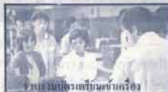
กรรมการประจำห้องเรียนตรวจ