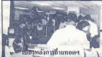
เบื้องหลังการถ่ายทอศฯ