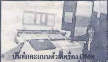
บัณฑิตกะเกณฑ์ด้วยเครื่อง G.M.I.