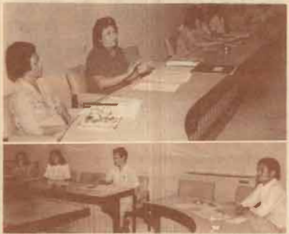
สนทนาวิชาการ คณะกรรมการพัฒนาบุคลากร ม.ร. จัดการสนทนาทางวิชาการ ครั้งที่ 2 เมื่อวันที่ 15 กุมภาพันธ์ 2527 ณ ห้องประชุม สำนักงานสภาอาจารย์ โดยมีอาจารย์ที่ได้รับทุนไปฝักอบรม และดูงาน ณ ต่างประเทศ มาแล้วเป็นวิทยากร