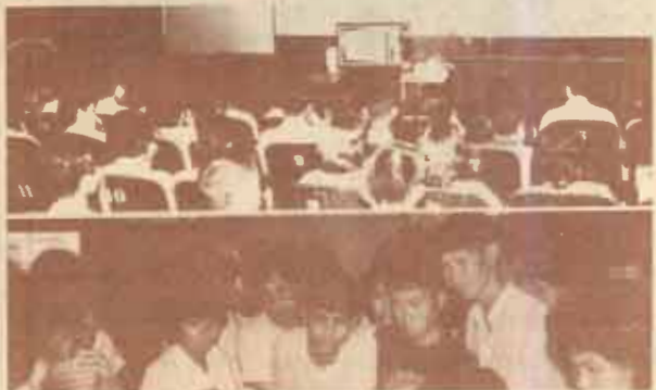
สารคดีคอมพิวเตอร์ ชมรมสถิติและคอมพิวเตอร์ จัด การบรรยายพิเศษเรื่อง คอมพิวเตอร์กับสังคม เมื่อวันที่ 15 กุมภาพันธ์ 2527 ณ ห้องประชุมเอ.ดี. 2 (โรงแรมสารงกา)