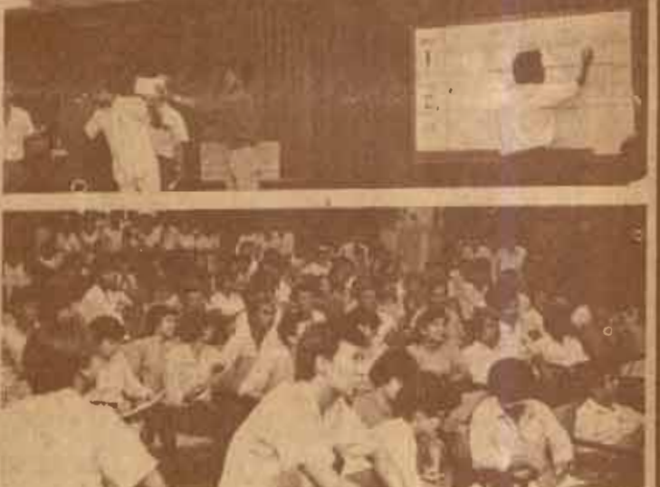
หยังเสียง ข้าราชการและเจ้าหน้าที่ สำนักบริการทางวิชาการและทดสอบประเมินผล (สวป.) ดำเนินการหยังเสียงเพื่อสรรหาผู้อำนวยการคนใหม่ เมื่อวันที่ 21 กุมภาพันธ์ 2527 ณ ห้องประชุม สวป. 1/15