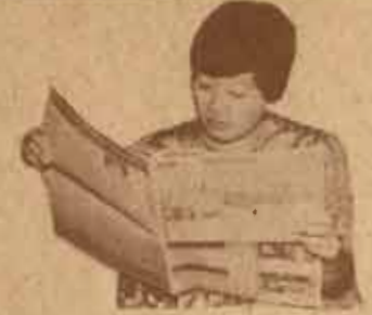
อ่านข่าวรามฯ ทำให้ทราบความเคลื่อนไหวภายในรามฯ

มหาวิทยาลัยได้พิจารณาเรื่องนี้อย่างรอบคอบและมีความเห็นว่าการที่นักศึกษามุสลิมจำนวน 6 คน ถูกคุมขังมาเป็นเวลานานทำให้เสียสุขภาพจิต และการเรียนโดยที่ยังไม่มีการตัดสินว่าผิดจริงหรือไม่เป็นประเด็นที่ได้รับความเห็นอกเห็นใจ