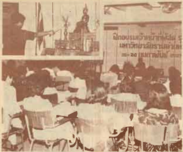
ฝักอบรม รศ.สุภุม นวลสกุล อธิการบดีมหาวิทยาลัยรามคำแหง เป็นประธานในพิธีเปิดการฝักอบรมเจ้าหน้าที่พัสดุ รุ่นที่ 1 เมื่อวันที่ 20 กุมภาพันธ์ 2527 ณ ห้องประชุม ชั้น 4 คณะเศรษฐศาสตร์