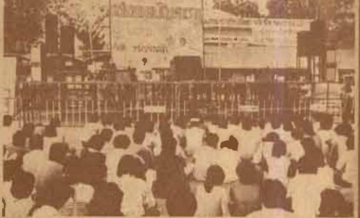
พบนักศึกษา อสมร.จัดรายการพบนักศึกษา ในภาค 2/2527 เมื่อวันที่ 15 กุมภาพันธ์ 2527 ณ บริเวณลาน สวป. โดยเชิญ รศ.สุขุม นวลสกุล อธิการบดี และ ผศ.ดร.กิตติ จริณยานนท์ รองอธิการบดีฝ่ายกิจการนักศึกษามาศึกษา และตอบข้อซักถามต่าง ๆ ของนักศึกษา

ตามที่สำนักบริการทางวิชาการและทดสอบประเมินผล (สวป.) ได้ดำเนินการสรรหาผู้อำนวยการคนใหม่ เมื่อวันที่ 21 กุมภาพันธ์ 2527 โดยมีผู้เข้ารับการสรรหาจำนวน 2 คน คือ หมายเลข 1 นายสมชาย น้อยฉ่ำ และหมายเลข 2 นายเฉลิมเผ่า อจละนันท์ นั้น ผลการสรรหาปรากฏ ดังนี้ หมายเลข 1 นายสมชาย น้อยฉ่ำ ได้ 184 คะแนน หมายเลข 2 นายเฉลิมเผ่า อจละนันท์ ได้ 148 คะแนน บัตรเสีย 3 ใบ รวมผู้มีสิทธิ 335 คน คณะกรรมการสรรหาฯ จะได้เสนอผลการสรรหาให้สภามหาวิทยาลัยพิจารณาแต่งตั้งต่อไป