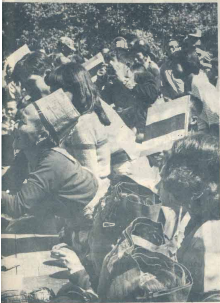
ภาพพระราชทาน

ที่บางช่วงเคียน อำเภอเมือง จังหวัดเชียงใหม่ ได้ทอดพระเนตรสุกพันธุ์ผสมที่พระราชทานแก่เขาในหมู่บ้านนี้เลี้ยงไว้ และทรงมีพระราชปฏิสันถารแก่หัวหน้าชาวเขามีพระราชดำริด้วยความห่วงใยถึงการเพาะปลูกและการครองชีพ โดยเฉพาะทรงแนะนำให้เลี้ยงแกะเพื่อใช้บริโภคและจำหน่ายเป็นรายได้เลี้ยงครอบครัว ทรงเยี่ยมหมู่บ้านปูในซึ่งเป็นหมู่บ้านมุสลิมแดง พระราชทานแกะและไก่พันธุ์โรดไอร์แลนด์เรด แก่หัวหน้าหมู่บ้านเพื่อนำไปเลี้ยงและแพร่พันธุ์ ได้ทอดพระเนตรและพระราชทานพระราชดำริเกี่ยวกับระบบการนำน้ำจากภูเขามาใช้ในหมู่บ้านเพื่อบริโภคและใช้ในการเพาะปลูกและเลี้ยงสัตว์ ทรงเยี่ยมหมู่บ้านเงินฮ่อ ที่บ้านหลวง หมู่บ้านคุมที่ค้อย่างขวาง หมู่บ้านแม่โถหลวง ทรงมีพระราชดำรินำให้ชาวบ้านปลูกต้นไม้เพื่อรักษาดินและแหล่งน้ำ