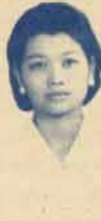
น.ส.สรวิทย์ พงษ์เยี่ยม รองนายกฯ คนที่ ๒