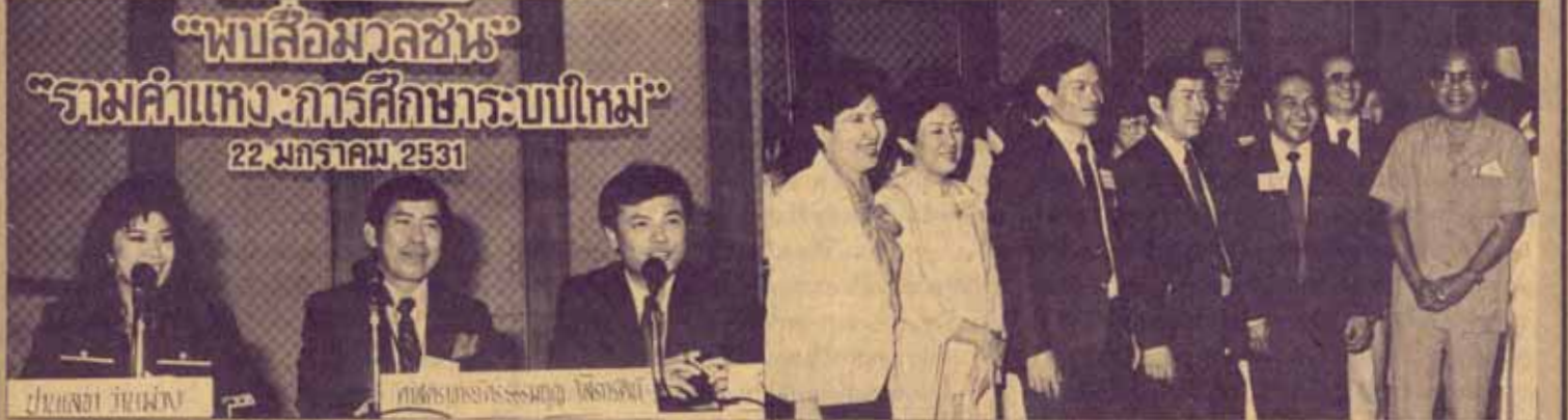
“พบสื่อมวลชน” “รวมคำแฉ่ง: การศึกษาระบบใหม่” 22 มกราคม 2531

ปีที่ ๓๗ ปีการศึกษา ๒๕๓๐ ราคา ๑/๕๐ สตางค์