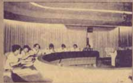
เตรียมการเลือกตั้ง เมื่อวันที่ 17 มกราคม 2531 ณ ห้องประชุมสำนักงานอธิการบดี ชั้น 5 รังสิตศาสตราจารย์วิชาเคมี จีไอเอ็มซี รังสิต อธิการบดีฝ่ายกิจการนักศึกษา เป็นประธานในการประชุมคณะกรรมการดำเนินงานเลือกตั้ง อ.ส.ม.ว. และ ส.ม.ว. ประจำปีการศึกษา 2531 ที่จะขึ้นในวันที่ 17 กุมภาพันธ์ 2531