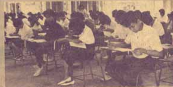
สอบซ่อม มหาวิทยาลัยรามคำแหง ดำเนินการสอบซ่อมของภาค 1/2530 เมื่อวันที่ 16 - 25 มกราคม 2531 ณ หอประชุมรามคำแหง 1

2 ที่ แต่ต่างช่วงเวลากัน คือ ช่วงเช้า (เวลา 09.00-12.00 น.) ให้อั่งคะแนนเลือกตั้งได้เฉพาะที่รวมฯ 2 (บางนา) ส่วนช่วงบ่าย (เวลา 13.00-16.00 น.) ให้อั่งคะแนนเลือกตั้งได้เฉพาะที่รวมฯ 1 (หัวหมาก) การมาใช้สิทธิเลือกตั้งนั้น นักศึกษาต้องนำบัตรประจำตัวนักศึกษามาแสดงต่อเจ้าหน้าที่ประจำหน่วยลงคะแนนเลือกตั้งด้วย โดยไม่ต้องเตรียมดินสอดำและยางลบมา เพราะทางมหาวิทยาลัยได้เตรียมไว้ให้แล้วในทุกศาลาจะคะแนนเลือกตั้ง จึงขอเชิญชวนนักศึกษา มหาวิทยาลัยรามคำแหงทุกคนมาใช้สิทธิเลือกตั้งโดยทั่วกัน