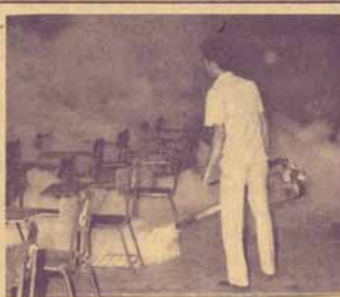
กำลังจัดของ กองอาคารสถานที่ ดำเนินการกำจัดของภายใน ม.ร. ด้วยภาพคนคว้นหมอกในอาคารเขียนและห้องสอบทุกอาคาร รวมทั้งทยอยย้ายลูกเก้าอี้ในสภาน้ำทุกแห่งภายในมหาวิทยาลัย เพื่อป้องกันการเพาะยุงแต่เบื้องต้น เมื่อวันที่ 15 มกราคม ที่ผ่านม