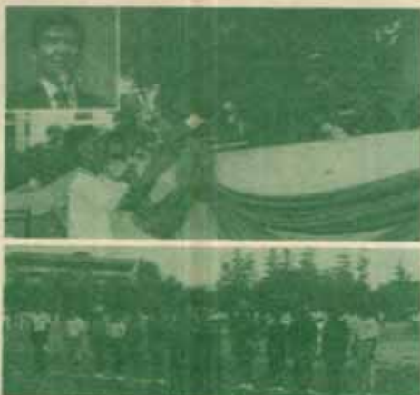
กีฬาภายใน เมื่อวันที่ ๑๒ กรกฎาคม ๒๕๕๔

ผู้สนใจขอทราบรายละเอียดเงื่อนไข ก่อนยื่นใบสมัครได้ที่ ฝ่ายทุนอุดหนุนการวิจัย ๒ กองส่งเสริมการ วิจัย โทร. ๒๕๖๒-๒๒๒๔, ๒๕๖๒-๖๒๒๖-๐๐ ต่อ ๒๒๒๖ โทร แฟกซ์หมายเลขที่ ๒๕๖๒-๒๒๒๔