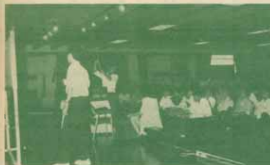
สหราชอาณาจักร คณะนิเทศศาสตร์ ม.ร.สหราชอาณาจักร เมื่อวันที่ ๓๑ กรกฎาคม ๒๕๓๔ ณ ห้องประชุมคณะฯ ตามผลการสรรหาใน "ข่าวรามคำแหง"ฉบับนี้

มร.จัดอบรม ต่อจากหน้า 1 ๓. หลักสูตร ENGLISH READING CLINIC (ERC) เป็นการอบรมและแก้ไขปัญหาและอุปสรรคในการอ่าน เน้นการอ่านเป็นหน่วยความหมาย การวิเคราะห์ย่อหน้า เพื่อทำความเข้าใจความสัมพันธ์ของประโยคต่างๆ ที่สื่อความหมายสำคัญและราย ละเอียดต่างๆ ในย่อหน้า ขอเชิญนักศึกษาและผู้สนใจสมัครเข้ารับการอบรมได้ที่งานการเงิน คณะมนุษยศาสตร์ ตึก ๑ ชั้น ๒ ค่าลงทะเบียนหลักสูตรละ ๗๐๐ บาท สอบถามรายละเอียดเพิ่มเติมได้ที่ โทร. ๓๑๘๐๐๕๔-๕๕, ๓๑๘๐๘๘๘ และ ๓๑๘๐๔๓๐