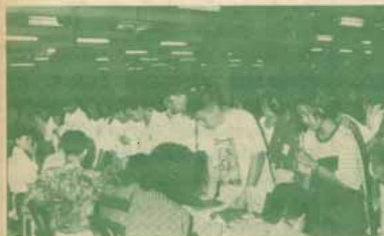
ลงทะเบียน มหาวิทยาลัยรามคำแหง ลงทะเบียนเรียน ภาค ๑ ปีการศึกษา ๒๕๓๔ ระหว่างวันที่ ๑-๘ สิงหาคม ๒๕๓๔