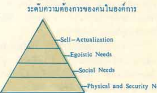
(ปรับมาจาก Sayles and Strauss, op. cit p. 7)

ความต้องการของคนในองค์กรอาจสังเกตได้จากลักษณะของคน ๒ ประการคือ (๑) ความพอใจในสิ่งที่ต้องการ (๒) ความไม่พอใจอันเกิดจากสิ่งที่ไม่ต้องการ ถ้าเกี่ยวกับงาน แล้ว ความพอใจ ของคน ต่องาน มี ๓ แบบคือ : (๑) ไม่อยากทำงาน (Off-the Job) (๒) ทำบ้างไม่ทำบ้าง ซอบกอบ (Around the Job) และ (๓) พอใจที่จะทำงานของตนเต็มที่ (Through the Job) ฉะนั้นผู้นำองค์กรที่ดีจึงควรศึกษาถึงความต้องการของคนว่า ในองค์กรของคนนั้นมีคนประเภทใดอยู่บ้าง มีความต้องการอย่างไร ที่ระดับ เพื่อหากรรมวิธีต่าง ๆ หรือคุณลักษณะมาปฏิบัติต่อคนเหล่านั้น เพื่อความพอใจของทุกฝ่ายในองค์กร และผลงานจะได้บรรลุสู่เป้าหมาย