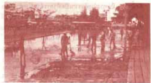
เจ้าหน้าที่ ม.ร. ดำเนินทำความสะอาดบ่อน้ำบริเวณคลอง