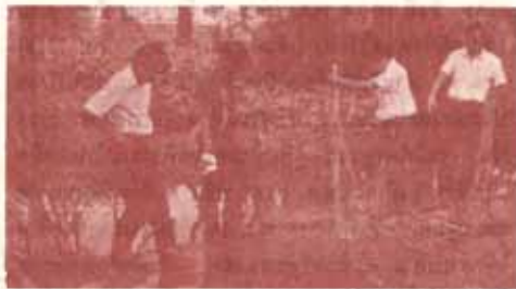
กรรมการเฉพาะกิจฯ วางแผนดูบ่อน้ำออกจาก ม.ร.