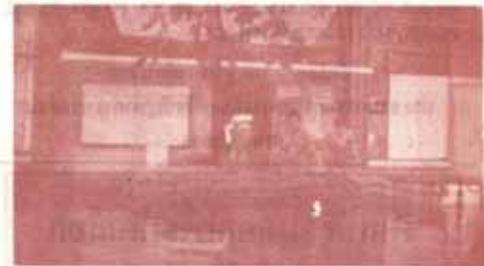
ทหารอากาศกองทัพบกรมาร่วมกับเจ้าหน้าที่ ม.ร. สร้างกำแพงทรายเพื่อดูบ่อน้ำออก ณ คลองตำรา NB 12