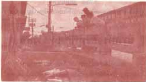
มหาวิทยาลัยร่วมกับ กทม. ดำเนินขุดบ่อน้ำ ออกจาก ม.ร. และ บริเวณใกล้เคียง