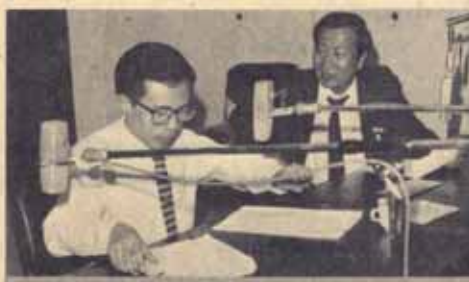
รายการศิลปะจัดแสดงที่ ๓.สุวรรณัง วัฒนธรรม บัณฑิต ม.ร. วัน ๖ ที่เกิดคืนจักรวาลวิทยุ "สรรหามาแล้ว" ทุกวันเสาร์ เวลา 18.30-19.00 น. ทางสถานีวิทยุกระจายเสียงแห่งประเทศไทย รายการ ๒ เพื่อการศึกษา ความดี ๘๘๐ กิโลเฮิรตซ์ ในระบบ A.M.