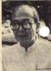
ณรงค์ วัชรกุล

ข้อ 3. พิจารณาอนุมัติพระราชกำหนด ซึ่งเสนอต่อสภาผู้แทนราษฎรภายหลังรัฐบาลได้ประกาศใช้บังคับเป็นกฎหมาย ในระหว่างสมัยประชุมรัฐสภา หรือนอกสมัยประชุมรัฐสภา ให้มีผลบังคับพระราชบัญญัติ (กฎหมาย) ทั้งนี้เพราะมีความจำเป็นต้องออกกฎหมายเกี่ยวกับการภาษีอากรหรือเงินตรา ซึ่งจะต้องได้รับการพิจารณาโดยด่วน และฉบับเพื่อรักษาประโยชน์ของแผ่นดิน (กรณีในระหว่างสมัยประชุมรัฐสภา) และในกรณีฉุกเฉินที่มีความจำเป็นรีบด่วนในอันจะรักษาความปลอดภัยของประเทศ หรือความปลอดภัยสาธารณะหรือความมั่นคงในทางเศรษฐกิจของประเทศ หรือป้องกันภัยพิบัติสาธารณะ (กรณีนอกสมัยประชุมรัฐสภา)