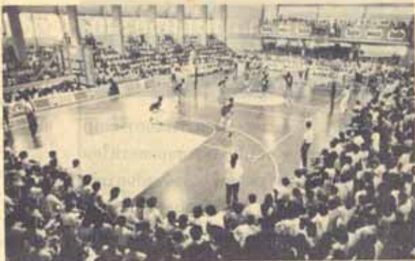
วอลเลย์บอลของ "15 ปี ม.ร." ตามที่ชมรมกีฬาวอลเลย์บอล ม.ร. ร่วมกับสมาคมวอลเลย์บอลสมัครเล่นแห่งประเทศไทย ได้จัดการแข่งขัน วอลเลย์บอล คุณศึกษา ระหว่างวันที่ 10 - 19 สิงหาคม ที่สนาม ๘ สนาม GB 2 ภายในมหาวิทยาลัยรามคำแหง นั้น เมื่อวันที่ 14 สิงหาคม 2529 ได้ มีการแข่งขันวอลเลย์บอลสมัครเล่น ในโอกาส "15 ปี รามคำแหง" ด้วย โดยเป็นการแข่งขันระหว่างทีมเยาวชน ซึ่งเป็นทีมชาติผู้ป็นที่แะแะแะ แข่งขันเพื่อเตรียมทีมแข่งขันวอลเลย์บอลเยาวชนชิงชนะเลิศแห่งประเทศไทย ในเดือนกันยายน นี้ กับทีมเยาวชนทีมชาติไทย ณ GB 2 โดยมีผู้สนใจเข้า ชมจำนวนมากผลการแข่งขัน ทีมเยาวชนไทย ชนะ 3 : 2

ประธานกรรมการดำเนิน การจัดงานเดินการกุศล ซึ่งแจ้งเพิ่ม เดิมว่า การจัดงานครั้งนี้ เป็นความ ร่วมมือระหว่างมหาวิทยาลัยกับกลุ่ม สื่อสารมวลชน ซึ่งเป็นกลุ่มนักศึกษา มหาวิทยาลัยรามคำแหง โดยกลุ่มฯ