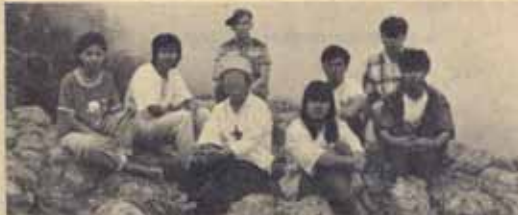
สัมมนา กลุ่มศิลา มหาวิทยาลัยรามคำแหง ซึ่งเป็นกลุ่มนักศึกษาที่มีวัตถุประสงค์ทางด้านบำเพ็ญสาธารณประโยชน์ ได้จัดโครงการสัมมนาภายนอก เมื่อวันที่ 9-11 สิงหาคม 2529 ณ อุทยานแห่งชาติภูหินร่องกล้า จังหวัดพิษณุโลก