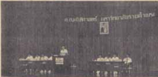
ไคววที คณะนิติศาสตร์ ม.ร. จัดการไคววที ในงาน "วชิรทศ" 29 เมื่อวันที่ 6 สิงหาคม 2529 ณ หอประชุมใหญ่ 10.11 โดยเป็นการไคววทีในชุดที่ "นักปราชญ์ที่ไว้หือจะสู้วิกฤตมหาชัย" ระหว่างทีมมหาวิทยาลัยธรรมศาสตร์กับทีมมหาวิทยาลัยกรุงเทพ