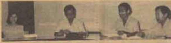
สภามหาวิทยาลัย คณะกรรมการพัฒนาบุคลากร ม.ร. จัดรายการสภามหาวิชาการ เมื่อวันที่ 14 มีนาคม ที่ผ่านมา ณ สำนักงานสภาอาจารย์