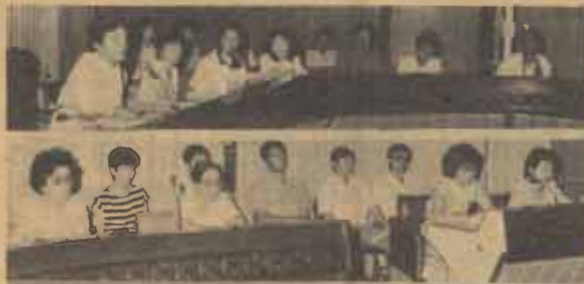
พนักงานหน่วยงาน มหาวิทยาลัยประชุมหัวหน้าหน่วยงานต่าง ๆ ในสำนักงานอธิการบดี เพื่อชี้แจงเกี่ยวกับการดำเนินงานโดยทั่วไป เมื่อวันที่ 9 มีนาคม 2527 ณ ห้องประชุม ชั้น 6 สำนักงานอธิการบดี

● ข่าวรามคำแหง ฉบับนี้เป็นฉบับที่ 46 ประจำวันที่ 26 มีนาคม 2527 ● สภามหาวิทยาลัยรามคำแหง ในสัปดาห์นี้ยังอยู่ในช่วงการสอบไล่ ภาค 2/2526 จนถึงวันที่ 11 เม.ย. 27 ● วันที่ 26 มี.ค. 27 เป็นต้นไป มหาวิทยาลัยเริ่มจำหน่ายใบสมัครและรับสมัครนักศึกษาใหม่ทางไปรษณีย์ โดยจำหน่ายจนถึงวันที่ 21 พ.ค. 27 และรับสมัครจนถึงวันที่ 25 พ.ค. 27 ใบสมัครราคาชุดละ 40 บาท และค่าส่งอีก 5 บาท ผู้สนใจสั่งซื้อได้ที่หัวหน้าฝ่ายรับสมัครและแนะแนว สำนักบริการทางวิชาการและทดสอบประเมินผล มหาวิทยาลัยรามคำแหง กรุงเทพฯ 10241 โดยส่งตัวแลกเงินไปรษณีย์ สั่งจ่ายในนามมหาวิทยาลัยรามคำแหง ปท.รามคำแหง ● ส่วนการจำหน่ายใบสมัครที่ม.ร. จะเริ่มตั้งแต่วันที่ 8 พ.ค. - 26 มิ.ย. 27 และรับสมัครที่ ม.ร. ระหว่างวันที่ 11 - 28 มิ.ย. 27 ใบสมัครราคาชุดละ 20 บาท ● สำหรับพิธีพระราชทานปริญญาบัตรแก่ผู้สำเร็จการศึกษา ประจำปีการศึกษา 2525 (รุ่นที่ 9) กำหนดในวันที่ 11, 16 - 20 และ 22 เม.ย. 27 (เป็นเวลา 7 วัน) ณ อาคารใหม่สวนอัมพร ● มหาวิทยาลัยขอให้นักศึกษาไปรายงานตัวที่คณะที่ตนสังกัด ระหว่างวันที่ 30 มี.ค. - 3 เม.ย. 27 โดยนำรูปถ่ายขนาด 2 นิ้ว จำนวน 2 รูป ไปมอบให้กรรมการฝึกซ้อมที่คณะด้วย ● ส่วนกำหนดการฝึกซ้อมครั้งที่ 1 ณ ห้องประชุม เอ.เค. 1 ระหว่างวันที่ 6-7-8-9 เม.ย. 27 ขอให้นักศึกษามาฝึกซ้อมตามกำหนดด้วย (ตามรายละเอียดในข่าวรามคำแหงฉบับนี้) ● วันที่ 30 มี.ค. 27 อ.วิลาศ นนวิวัฒน์ และ ผศ.อาทิตย์ จันทวิมล ประธานคณะกรรมการประชาสัมพันธ์ ม.ร. ร่วมกันแถลง