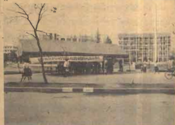
ปศ.ภคตสข ประชาสัมพันธ์ มหาวิทยาลัยรามคำแหง จัดตั้งพื้นที่ประชาสัมพันธ์การสอบ บริเวณสระน้ำ หน้ามหาวิทยาลัย ในช่วงการสอบไล่ภาค 2/2527 เพื่อให้คำแนะนำแก่ผู้มาสอบที่มีปัญหาและแจกคู่มือการสอบ