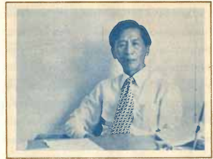
แนะนำหัวหน้าภาควิชากฎหมายมหาชน

ตอบ ชอบครับ อีกอย่างหนึ่ง ภาษาไทยเป็นวิชาที่ผมพอจะเรียนได้ด้วยตนเอง โดยไม่ต้องมาเข้าชั้น เพราะผมต้องทำงาน ที่อาคาร เรือ สุมั สมอ มี และผมก็ชอบ ทางด้าน สื่อสารมวลชนด้วย คิดว่า การมา