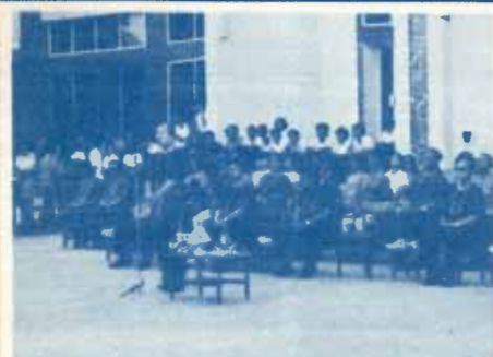
ทำนอธการบดี กล่าวคอบนายกษมนุมนักศึกษาชาวเหนือ ซึ่ง กล่าวแสดงความเคารพอาจารย์ก่อน 'รดน้ำดำหัว'