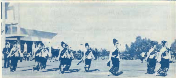
ขบวนเพื่อนเลิบ

นักศึกษาที่ยื่นคำร้องขอหนังสือรับรองเพื่อลดค่าโดยสารรถไฟไว้ที่แผนกกิจกรรมนักศึกษา ให้ไปรับหนังสือรับรอง ๆ ได้ ตั้งแต่วันที่ ๕ พฤษภาคม ๒๕๑๕ เป็นต้นไป