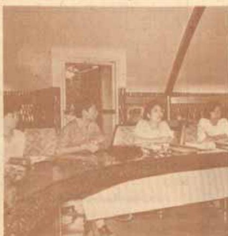
บรรณารักษณ์ ข่าวสารสาย ข. และ สาย ค. ของ มหาวิทยาลัยที่เดินทางไปดูงาน 4 ประเทศ (มาเลเซีย สิงคโปร์ อินโดนีเซีย และเกาหลี) ได้ชมบรรยากาศเกี่ยวกับ การไป ดูงานครั้งนี้แก่ผู้สนใจ เมื่อวันที่ 29 กรกฎาคม 2529 ณ ห้องประชุมใต้หอรูปลูกษา