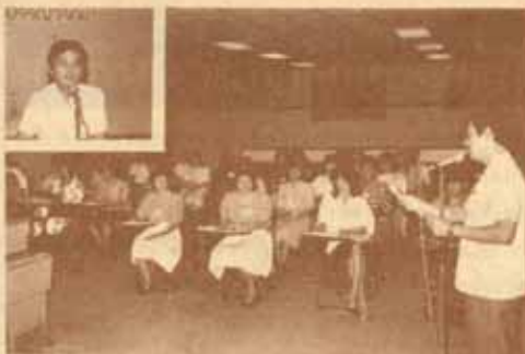
กิจกรรม คณะกรรมการ คำนึงการพัฒนาและฝึกอบรมบุคลากรของ ม.ร. จัดการฝึกอบรมเชิงปฏิบัติการหลักสูตร "การพิมพ์ประวัติวิทยานิพนธ์ฉบับร่าง" แก่บรรณารักษ์ของสำนักหอสมุดกลาง ม.ร. เมื่อวันที่ 1-3 สิงหาคม 2529 ณ ห้องประชุม ประมวล กุลนาคย์