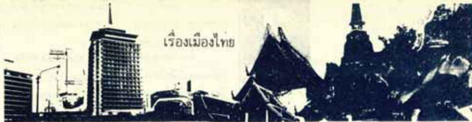
เรื่องเมืองไทย

ขอเชิญอาจารย์และนักศึกษา ม.ร. ศึกษาร่วมงานประชุมวิชาการ... ทุก ๆ ด้านเกี่ยวกับเมืองไทย ทั้งชีวิตประจำวัน อาชีพ เศรษฐกิจ ประวัติศาสตร์ วัฒนธรรม ฯลฯ ตลอดจนงาน ความร่วมมือ ๆ ทั้งในและต่างประเทศ