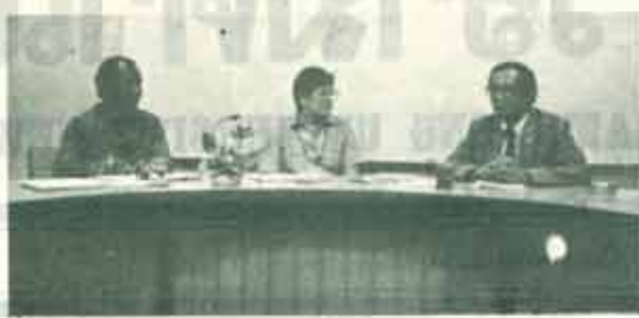
เยี่ยมชม น.ร.