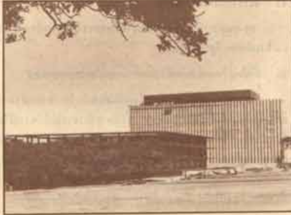
ห้องสมุด Fisher ในปัจจุบัน (ภาพถ่ายเมื่อ ค.ศ.1963)