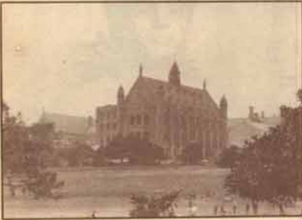
ห้องสมุด Fisher ในสมัยแรก ค.ศ.1909 ตั้งอยู่ภายในสี่เหลี่ยม Main Quadrangle