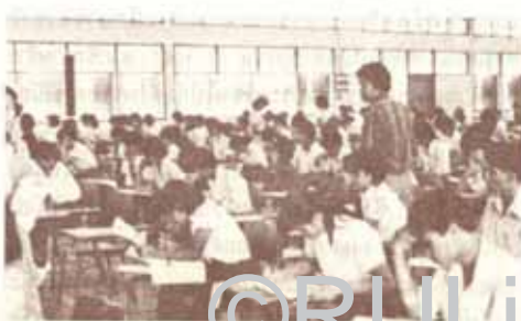
คร่ำเคร่ง เร่งเขียน เพียรให้ผ่าน