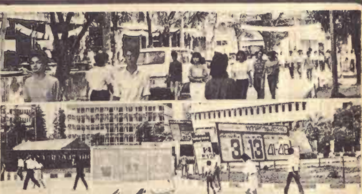
หาเสียง พรรคนักศึกษาที่สมัครเข้ารับการเลือกตั้งเป็นสมร.และอสมร. ต่างพรรคต่างหาเสียงโดยมีโปสเตอร์ต่าง ๆ ติดอยู่ที่มหาวิทยาลัยซึ่งในปีนี้ ทุกพรรคได้ตกลงร่วมกันในหลักการของการคิดโปสเตอร์ด้วยการแขวนด้วยเชือกแทนการติดกาบ และจะไม่มีการคิดโปสเตอร์ตามอาคารที่ทำการคณะ/สำนักและหน่วยงานต่าง ๆ