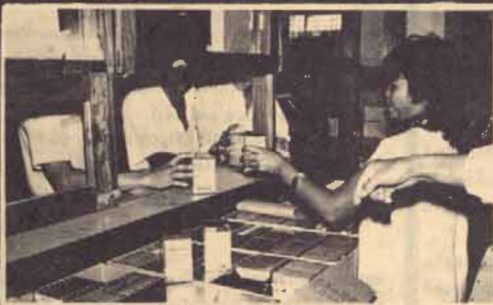
ตำราเสียง นักศึกษากำลังซื้อเทปตำราเสียงที่มหาวิทยาลัยจัดทำเป็นรุ่นแรก จำนวน 24 วิชา มีจำหน่ายที่แผนกสิ่งจอง ฝ่ายตำราฯ อาคารสายสีไทย