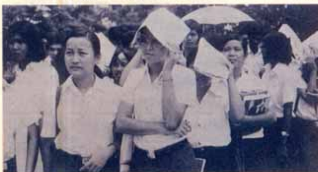
นี่คือทีม "พระแท่นคงรัง" เข้มแข็ง จริยจึง นำนิยม

..... แล้วเราจะได้สติใจเลือกสิ่งไหนที่ใช่