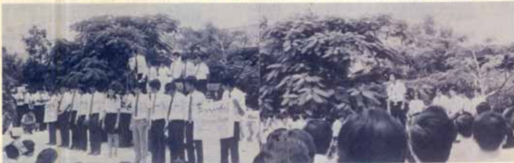
นี่คือทีม "คิงอาสน์" นโยบายของเราคือจึงนำเชื้อฉือ