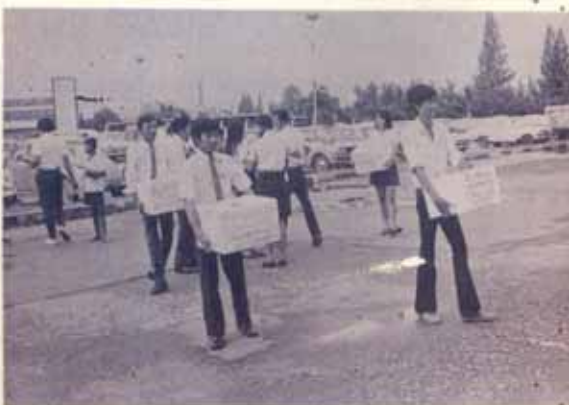
เรียงรายรถคอยหน้าประตูคักผู้บริจาครายต่อไป "แม้แค่กระแสมแรงก็แข็งขัน"