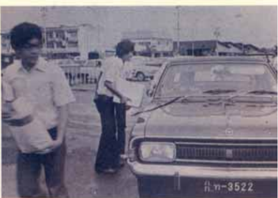
นักศึกษาวิเวกจัดรถบัสรับบริจาคจากผู้ประพอกทฤษฎีจังหวัดหนองคาย ท่านอธิการบดีบรรดพ่อนเงินก้อนใหญ่ลงในถังซึ่งมีก้นหนาไม่มีพาราวีโหล