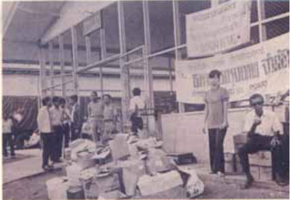
ชาว ม.ร. ทั้งอาจารย์และนักศึกษาร่วมใจสร้างพลังบริจาคเพียง ๒ วันได้เงินกว่าหมื่นบาทพร้อมเครื่องอุปโภคบริโภคอีกมากมาย เติมน้ำใจให้ชุมชนที่ห่างไกลจากจังหวัดหนองคาย ๒ หน่วยบรรเทาสาธารณภัย จังหวัดหนองคาย