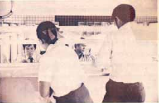
ด้วยความเชื่อเพื่ออย่างเร่งด่วน กรมไปรษณีย์ได้จัดพิมพ์ค้ำวาระไปรษณีย์เล่มนี้ขึ้นที่ รัชสีห์แดงเตชะเจดีย์กรุงเทพฯ ๑๖.๐๐ บาท... บัดนี้เราไม่ได้เห็นรถคนเขี่ยแล้วเพราะ นักศึกษาหญิง ชายได้รับความสะดวกอย่างถึง... ซึ่งผู้จำหน่ายจะตั้งอยู่ ภายใต้การดูแลของ ม.ร. คณะวนวิชาและไปรษณีย์โทรเลข ม.ร. ให้จัดส่งค้ำวาระไปรษณีย์ที่กรุงเทพฯ ๑๖.๐๐ บาท ไปรษณีย์แห่งเดียวที่รับไปรษณีย์ค้ำวาระ