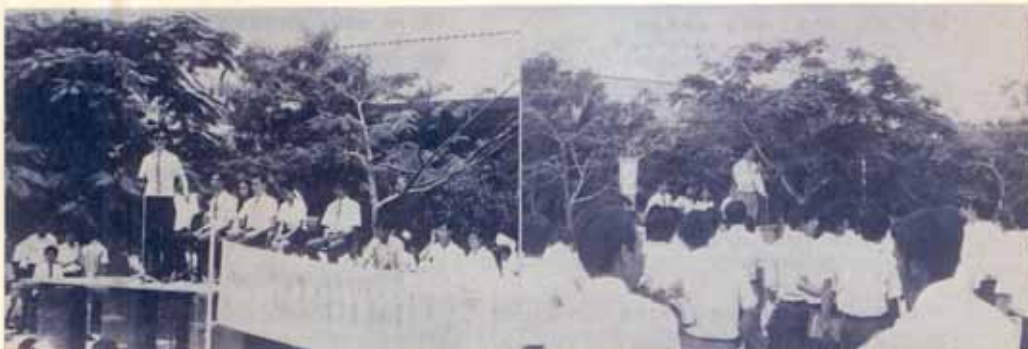
นี่คือทีม "คงศาล" แนวกแนวว่าทั้ง