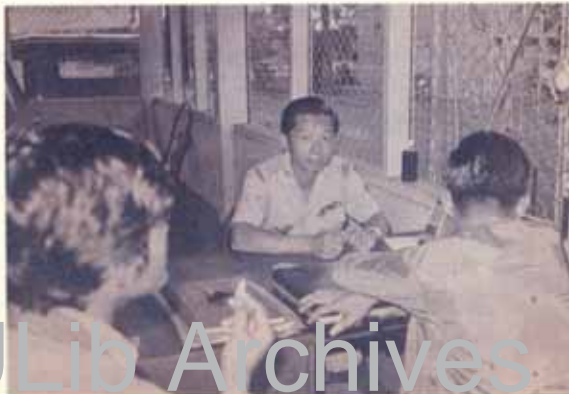
ม.ร. นครบาลอิมภามณ์ ม.ร. กุศลแห่งหนองคาย