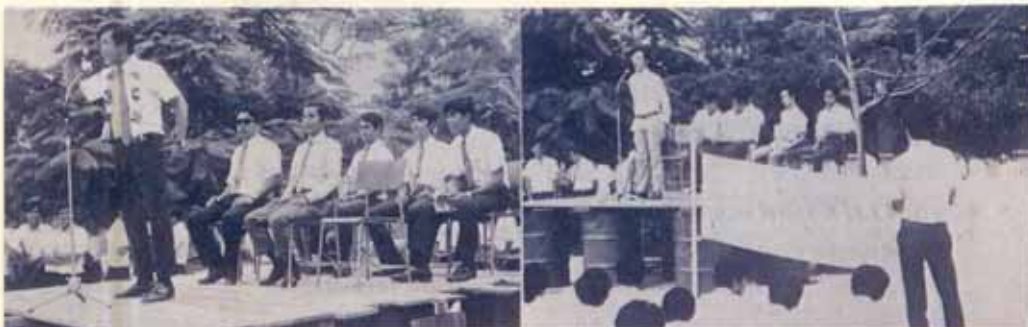
นี่คือทีม "ชายชื่อโท" ทว่างขวาง รอบด้าน นำนับถือ