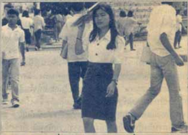
บัณฑิตมองที่ความรู้ สุภาพชนดูที่การแต่งตัว

ขอให้นักศึกษาชายนี้ ติดต่อบรรณารังวัลได้ที่ งานประชาสัมพันธ์ ม.ร. (ตึก เอ.ดี. 1 ชั้น 2) ภายในวันที่ 30 เมษายน 2533