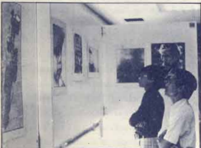
ภาพถ่ายชุดนี้ได้นำออกแสดง ณ สำนักงานใหญ่ บริษัทโกดัก (ประเทศไทย) จำกัด ถนนทรัพย์ ระหว่างวันที่ 18 เมษายน - 6 พฤษภาคม 2520 โดยเปิดให้เข้าชม เวลา 8.00-18.00 น. ทุกวัน เว้นวันอาทิตย์ หยุด 1 วัน

ทั้งนี้ ก็ด้วยวัตถุประสงค์ที่จะสนับสนุนศิลปะการถ่ายภาพให้เป็นที่แพร่หลายและเป็นการเปิดโอกาสให้ผู้ที่ยังไม่ได้ชมภาพ ซึ่งเป็นผลงานการถ่ายภาพ ของนักศึกษาระดับอุดมศึกษา ได้มีโอกาสชมภาพดังกล่าวด้วย