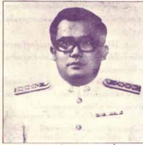
สาธิต ม.ร. เป็ตรับนักเรียนรุ่นใหม่

ด้วยปรากฏว่านักศึกษาบางคนพยายามนำข้อสอบ ทั้งฉบับ หรือบางส่วนออกนอกสนามสอบซึ่งเป็นการ ผิดวินัยระเบียบการสอบ และเป็นการผิดวินัยอย่างแรง และมหาวิทยาลัยเคยลงโทษให้สอบตกกระบวนวิชานั้นๆ หรือทุกกระบวนวิชาที่สอบ มหาวิทยาลัยจึงขอประกาศ ตกเดือนมาอีกครั้งหนึ่ง เพื่อผู้ที่รู้เท่าไม่ถึงการณ์ หรือ ทวงผลประโยชน์จากการพิมพ์ข้อสอบจำหน่าย ซึ่ง พยายามกระทำความผิดดังกล่าวอีกจะโดนลงโทษ และ ช่วยรักษาเกียรติภูมิของมหาวิทยาลัยอันเป็นที่รักของเรา ทุกคน มหาวิทยาลัยได้ส่งกัวให้อาจารย์เจ้าของวิชา งดตรวจกระดาษคำตอบของนักศึกษา ในกรณีที่ทราบ ว่ากระดาษคำตอบของนักศึกษาคู่นั้นหายไปทั้งหมดหรือ ขาดหายไปบางส่วน อนึ่ง มหาวิทยาลัยขอเรียนกำชับ อาจารย์ผู้ควบคุมสอบทุกท่านได้ช่วยตรวจกระดาษคำตอบ และคำตอบของนักศึกษาให้อยู่ในสภาพสมบูรณ์ก่อนนำ ส่งทุกครั้งด้วย