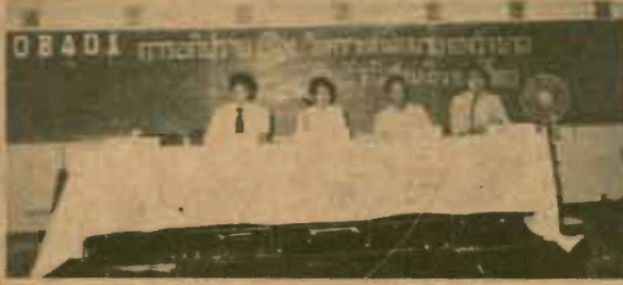
อภิปราย ภาพยนตร์บริหารธุรกิจ คณะรัฐศาสตร์ จัด การอภิปรายเรื่อง "วิเคราะห์นโยบายของรัฐบาลกับรัฐวิสาหกิจของไทย" ณ ห้องที่ทำการคณะรัฐศาสตร์ ห้อง 401 เมื่อวันที่ ๑๑ มี...