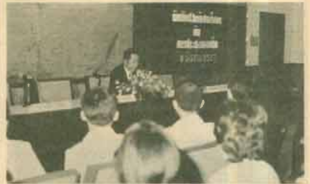
ปัจฉิมนิเทศ ภาควิชาโสตทัศนศึกษา คณะศึกษาศาสตร์ จัดการปัจฉิมนิเทศนักศึกษาวิชาเอกโสตทัศนศึกษารวม เมื่อวันที่ 8 มีนาคม 2527 ณ ห้องประชุมคณะศึกษาศาสตร์ ชั้น 3