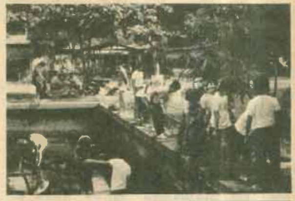
พัฒนา สภาอาจารย์ มหาวิทยาลัยรามคำแหง คำนึง การพัฒนาสภาอาจารย์โดยปรับปรุงสนามหญ้า ปลูกต้นไม้ รอบสำนักงาน และถ่ายน้ำในสระ เมื่อวันที่ 4 มีนาคม ที่ ผ่านมา โดยมี กรรมการสภาอาจารย์ และอาจารย์ ร่วมกัน พัฒนา