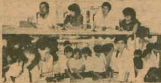
สัปดาห์หนังสือ ชมรมกานาไทยและกานาละวินออก จัดนิทรรศการ "สัปดาห์หนังสือ" เมื่อวันที่ 1-3 มีนาคม 2527 ณ บริเวณ ลานคณะศึกษาศาสตร์