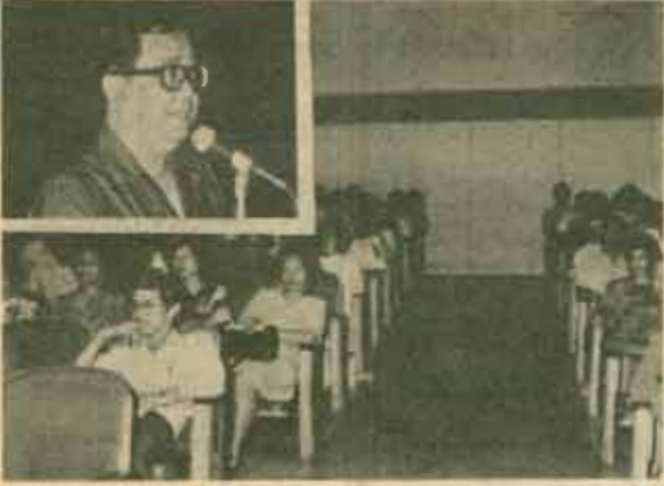
ประชุมสอบไล่ มหาวิทยาลัยประชุม หัวหน้าคึกสอบ และกรรมการฝ่ายต่าง ๆ เพื่อชี้แจงแนวปฏิบัติเกี่ยวกับการสอบไล่ ภาค 2/2526 เมื่อวันที่ 12 มีนาคม 2527 ณ ห้องประชุม เอ.ดี. 1