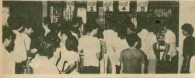
รับคู่มือสอบไล่ นักศึกษากำลังรับคู่มือและตารางสอบไล่ภาค 2/2526 ณ งานประชาสัมพันธ์ ตึก เอ.ดี.1