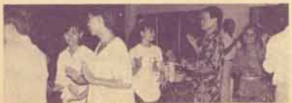
รองศาสตราจารย์วิชาวรรณย์ วิชาสิทธิ รองอธิการบดีฝ่ายกิจการนักศึกษา ร่วมกับศิลปินหญิงของลาว