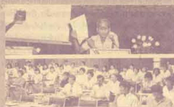
ฝึกอบรม ศูนย์บริการวิชาการและสนเทศ สำนักบริหารการวิชาการและหอสมุดประมงเฉลิม จัดฝึกอบรม เรื่อง "หลักและวิธีการพิมพ์ดีด" เมื่อวันที่ 9 สิงหาคม 2531 ณ ห้องประชุม ลาบ. ชั้น 5 โดยมีวัตถุประสงค์เพื่อพัฒนาบุคลากรให้มีควมรู้ความเข้าใจเกี่ยวกับหลักและวิธีการพิมพ์ดีดราชการอย่างถูกต้อง และคณะกรรมการที่ปรึกษาและจัดเจน