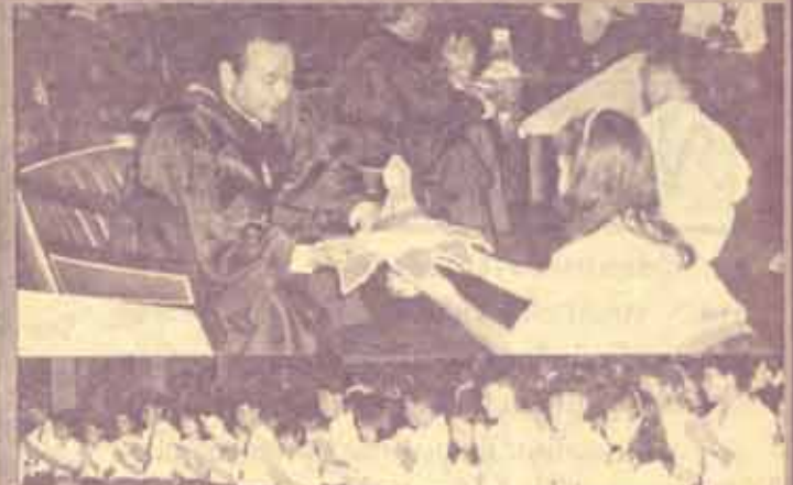
ไหว้ครู คณะศึกษาศาสตร์ ม.ร. จัดพิธีไหว้ครูประจำปีการศึกษา 2531 เมื่อวันที่ 18 สิงหาคม 2531 ณ หอประชุม เสด. 1

วันที่ 15-16 กันยายน 2531 ณ อาคาร PRB ชั้น 3 (รวมฯ 2) และเมืองศึกษา จังหวัดชลบุรี. ■ พรรคอภิปัตย์ ซึ่งเป็นพรรคกับบริหารองค์การนักศึกษา ได้กลับจากการจัดงานรับเพื่อนใหม่ภายนอก ที่น้ำตกลานสาง จังหวัดตาก และหลังจากนั้นได้ไปช่วยงานเยาวชนมิตรสัมพันธ์ขององค์การนักศึกษา ซึ่งจัดขึ้นที่วังตะไคร้ ออกเดินทางไปเมื่อวันที่ 28 สิงหาคม 2531 และจะกลับมาในวันพรุ่งนี้ (30 ส.ค. 31). ■ ส่วนพรรคนักศึกษา 5 ประสาน ก็จะไปเดินทางกลับจากการไปจัดงานรับเพื่อนใหม่ภายนอกที่หาดแม่รำพึง จังหวัดระยอง ในวันนั้น (29 ส.ค. 31) ก็เดินทางกลับที่มหาวิทยาลัย. ■ ทางด้าน พรรคสังคมนิยม เตรียมเดินทางไปจัดงานเพื่อนใหม่ภายนอกที่ อุทยานวังงิ้ว จังหวัดเพชรบูรณ์ ในระหว่างวันที่ 2-5 กันยายน 2531..... ■ ในระหว่างวันที่ 22-24 สิงหาคม 2531 ชมรมกั๊กกั๊กป้องกันตัว อ.ส.ง. จัดแข่งขันกีฬามวยภายใน มีพรรคนักศึกษาเพียงพรรคเดียวเท่านั้น คือ พรรคเปลวเทียน ได้จัดส่งนักมวยลงแข่งขันด้วย. ■ เมื่อวันที่ 26 สิงหาคม 2531 ณ เวทีสาธิต ลาบ ปาก เสวต วิทยารุ่งเรืองศรี ประธานสภานักศึกษากองแรก (ปี 2531) ของมหาวิทยาลัยธรรมศาสตร์ ได้มอบเกียรติบัตร