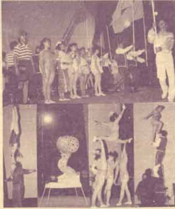
คณะนักศิลปศึกษา กำลังแสดงให้ชาวรามคำแหงและผู้สนใจทั่วไปชมที่หอประชุมใหญ่ เอ.ดี. 1