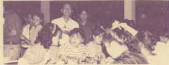
กรรมการสภานักศึกษาและสมาชิกสภานักศึกษา ถ่ายรูปร่วมกับศิลปินหญิงจากประเทศลาว