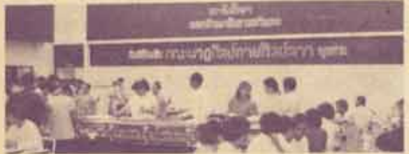
สถาบันศึกษามหาวิทยาลัยรามคำแหง (ส.ม.ว.) จัดงานเลี้ยงเชื่อมสัมพันธ์มิตรไทย-ลาว ณ หอประชุม เอ.ดี. 1