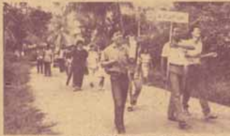
พิธีอัญเชิญ ร.ร.จากเตนท์สู่อาคาร ร.ว.ไทยรัฐ 74 อ.ลานตะกา จ.นครราชสีมา

ประหยัด ส่วนใหญ่จะเน้นสื่อจากเศรษฐกิจ หรือวิศวะหา ง่าย ซึ่งครูส่วนใหญ่สนใจและเห็นว่าเป็นไปได้ในการ นำไปใช้จริง