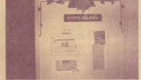
มุมต่าง ๆ ในห้องสมุดไทยรัฐ 74

จากการที่ได้ร่วมทำงานกับมูลนิธิ น.ส.พ.ไทยรัฐ ทำให้ทราบว่า มูลนิธิ น.ส.พ.ไทยรัฐ เป็นองค์การการกุศล ได้สร้างโรงเรียนไทยรัฐวิทยา มอบให้กับสำนักงานการประถมศึกษาแห่งชาติทั่วประเทศ นอกจากนี้ยังได้มอบเงินเพื่อตั้งมูลนิธิกับโรงเรียนทุกโรงเรียน 2 แห่งบาท มีทุนโครงการอาหารกลางวัน ทุนซื้อหนังสือสำหรับห้องสมุด แจกเสื้อผ้า สมุด ดินสอ ตลอดจนอุปกรณ์ต่าง ๆ และในแต่ละปีจะมีการจัดประชุม-สัมมนาเรื่องที่เป็นประโยชน์แก่ครู และผู้บริหารโรงเรียนไทยรัฐวิทยาทั่วประเทศอีกด้วย