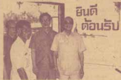
ยินดี ต้อนรับ

ในระยะแรกเพื่อสะดวกในการขนอุปกรณ์ ผู้เขียน ได้เตรียมอุปกรณ์ประเภทสไลด์ แผ่นใส วิทยุทัศน์ ไปประ กอบรวบรวม แต่มีปัญหาอย่างมาก ด้านสถานที่อบรม เพราะทุกแห่งใช้ให้ศูนย์อาคารเรียนที่มีแสงสว่างเข้าทุก ทิศทาง แม้กลุ่มโรงเรียนจะมีครูวิทยุทัศน์ เช่น เครื่องฉาย สไลด์ เครื่องฉายข้ามศีรษะ หรือโทรทัศน์และวีดิโอเทป แต่ส่วนใหญ่จะไม่ได้ใช้ เพราะมีปัญหาด้านสถานที่ และ ไม่มีสไลด์และตลับวิทยุทัศน์ รวมทั้งต้นทุนการผลิตค่อนข้างสูง โรงเรียนบางแห่งยังไม่มีไฟฟ้าใช้ โรงเรียนบางแห่ง แม้มีไฟฟ้าใช้แต่กำลังไฟต่ำมาก ทั้งโรงเรียนมีหลอดไฟ ๑ ดวง ไม่มีปลั๊กไฟฟ้า จากการฝึกอบรมทำให้ได้ข้อคิด คือการสอนสำหรับชนบทนั้น ควรเป็นสื่อที่ใช้ง่าย ราคาถูก ควรเน้นสีสันและรูปแบบที่สะดุดตา เร้าความ สนใจของเด็กได้ดี เช่น แผ่นภาพเคลื่อนไหว (ด้วยเอ็น) ภาพวงล้อหมุน ภาพสามมิติ หุ่นมือ หุ่นอุ้งกระดาม แผ่นความรู้ แผ่นอ่าน ฯลฯ และคณะวิทยากรได้ใช้ รูปแบบของสื่อเหล่านี้โดยให้สอดคล้องกับหลักสูตรประถม ศึกษา คือ กลุ่มส่งเสริมประสบการณ์ชีวิต (สขช.) กลุ่ม ส่งเสริมลักษณะนิสัย (สสน.) กลุ่มการงานพื้นฐาน อาชีพ (กฟอ.) กลุ่มทักษะ และกลุ่มประสบการณ์พิเศษ