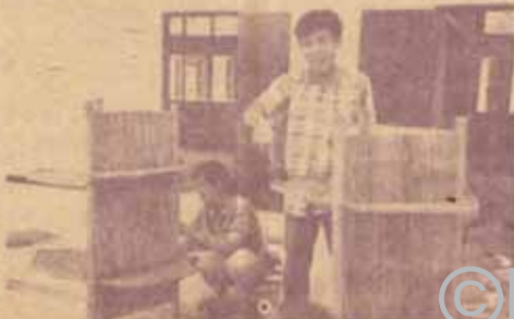
ช่วยกันจัดห้องสมุดไทยรัฐ 74 อ.ลานสะกา

ครั้งที่ 13 โรงเรียนไทยรัฐวิทยา 76, 77, 78 อ.ท่าแซะ และอ.ปะทิว จ.สุราษฎร์ธานี 24-28 เมษายน 2533