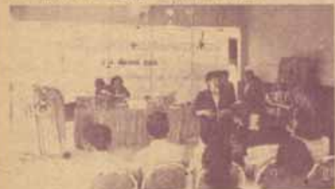
วิทยากรขณะฝึกอบรม

โครงการฝึกอบรมเรื่อง "การผลักดันห้องสมุดเคลื่อนที่" เป็นโครงการที่มูลนิธิหนังสือพิมพ์ไทยรัฐ ได้ขอความร่วมมือด้านวิทยากรจากสำนักหอสมุดกลาง มหาวิทยาลัยรามคำแหง เพื่อให้การฝึกอบรมแก่ครูโรงเรียนไทยรัฐวิทยาทั่วประเทศ และครูในสังกัด สำนักงานการประถมศึกษาแห่งชาติในเขตอำเภอที่ไปจัดการฝึกอบรม