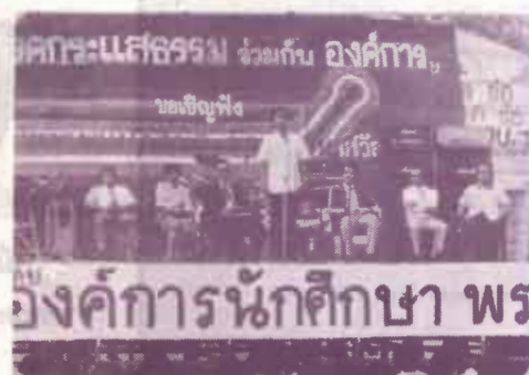
พบ นักศึกษา

ประวัติทุกคนไม่ต่างพริ้ว บดีทั้ง 6 ท่าน พร้อมกับยืนยันว่า "คณะ เพราะตั้งแต่อยู่รามคำแหงตั้งแต่ปี 2514 เป็นต้นมา ทั้ง 7 ท่านนี้ยังไม่เคยถูก รศ.สุขุม นวลสกุล อธิการบดี ผู้บริหารชุดใหม่ ทั้ง 7 ท่านรวมทั้งตัว ร.คนใหม่ ได้กล่าวแนะนำรองอธิการ ผมด้วย ผมวางใจในความซื่อสัตย์สุจริต อ่านต่อหน้า 8