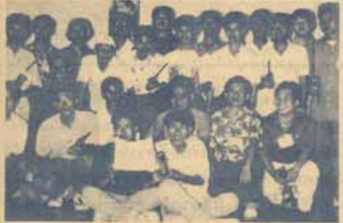
(เพื่อนสมาชิกชมรมวิทยุสมัครเล่นข้าราชการและเจ้าหน้าที่มหาวิทยาลัยรามคำแหง ร่วมงานการรายงานผลการเลือกตั้งสมาชิกสภาผู้แทนราษฎรเมื่อวันที่ 22 มีนาคม 2535 ให้กับกรมประชาสัมพันธ์ ณ คณะรัฐศาสตร์ มหาวิทยาลัยรามคำแหง)