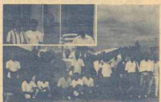
(ส่วนหนึ่งของเพื่อนสมาชิกชมรมนักวิทยุสมัครเล่นข้าราชการเจ้าหน้าที่มหาวิทยาลัยรามคำแหง นำหนังสือและอุปกรณ์การเรียนไปมอบให้โรงเรียนที่อำเภอพนมสนิม จังหวัดชลบุรี)