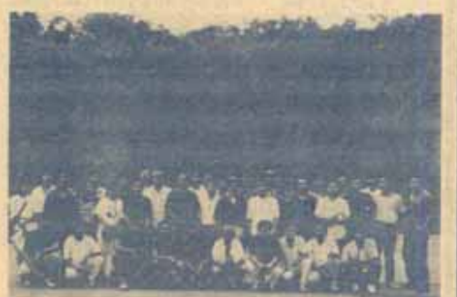
(เพื่อนสมาชิก ชมรมนักวิทยุสมัครเล่นข้าราชการและเจ้าหน้าที่มหาวิทยาลัยรามคำแหง DX ทดสอบสัญญาณกับเพื่อนสมาชิก ที่เขาเขียว จังหวัดชลบุรี)