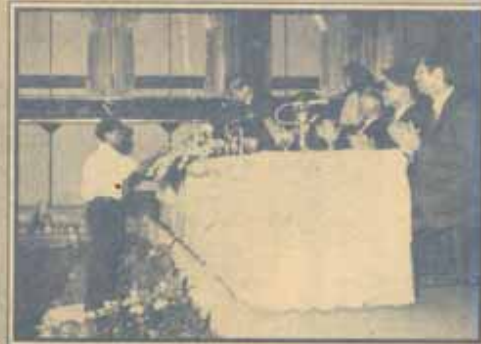
มอบทุนการศึกษา คณะเศรษฐศาสตร์ และ บริษัท กระจกไทย-อาเซียน มอบทุนการศึกษา ครั้งที่ 19 เมื่อวันที่ 10 กันยายน 2535 ณ ห้องเพลินจิต โรงแรมอิมพีเรียล ถนนวิภาวดี กทม.