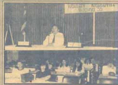
มีมมาภา คณะนิติศาสตร์ จัดสัมมนาเรื่อง "พัฒนาใจพัฒนางาน" ระหว่างวันที่ 18-20 กันยายน 2535 ณ ห้องประชุม คณะนิติศาสตร์ และวิทยาลัย การพัฒนารุชมชน อ.บพละมุง จ.ชลบุรี