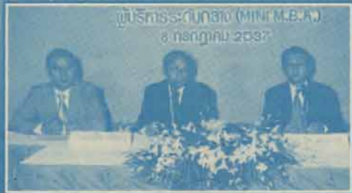
ผู้บริหารระดับสูง (MINI M.B.A.) 8 กรกฎาคม 2537