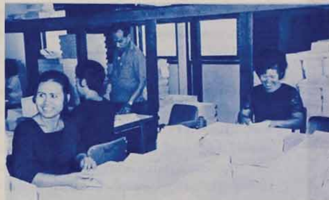
เจ้าหน้าที่ประกอบรูปเล่มหนังสือ

วันบูชา ๘ แทนคืนถิ่นนิมิตวาทีก ยานังจักรมหักกิจการิกมัน เมื่อกลับบับย์มีวันกับกะวัน เราต่างร่วมใจกันเอนมวิท อัญเชิญพระปฐม "รวมคำแหง" สดิกแห่งสถานการศึกษา พระเอณพระจอมปราชญ์ราชภิก แห่งสาถลัดยตีอักษรภาษาไทย ที่กรานไหวไว้วังระหว หรือให้ช่วยสอนได้ ไทให้ใจไม่ แต่เพราะระดิกถึงซาบซึ่งใจ จึงกราบไหวักักอญูรู้พระคุณ และศรัทธาในใจชีวิตนี้ จะทำทีกับตามเพื่อชุนา รือมัยดีใจเอนเพื่อเป็นทุน สมองหงุนซาติ ไทอากังใจจริง โอดะหนอพอชุนา ของลูกแก้ว บุชชแล้วใจกาทังซาอณบิว ขอพระองค์ทรงเป็นพลักลูกพิักพิง พอเป็นมิ่งขวัญมหาวิตยาลัย ประโยชน์ ๑๒๑