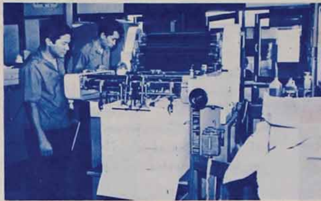
แท่นพิมพ์ SOLNA OFFSET พิมพ์งานด้วยระบบอัตโนมัติ ความเร็วชั่วโมงละ ๘,๐๐๐ แผ่น ใช้พิมพ์ทั้งคำขวัญและคำบรรยาย