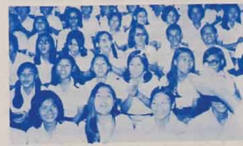
วันเร้าชุมชน แล้ววันพรุ่งนี้ไม่มีเพื่อนๆ