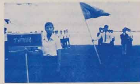
ดูรวมกันที่หน้า ๓-๐