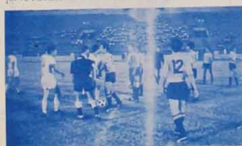
อู๊อู๊ประคู่ได้ก็อู๊อู๊อู๊ ๑ วัตถุประสงค์ เบียร์ ๑๑ สุรพันธ์ ศรีมิตร และ เบียร์ ๑๑ อู๊อู๊ สันติพันธ์อู๊อู๊