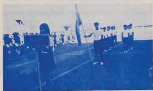
กีฬา VS รามคำแหง