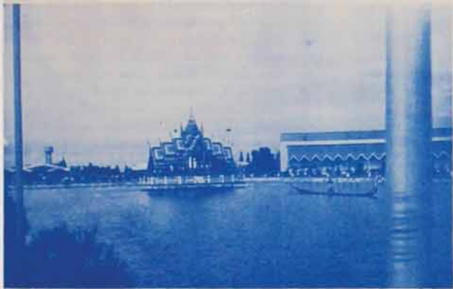
ศาลากลางน่าจะเป็นที่ประดิษฐาน พระบรมรูปพ่อขุนรามคำแหง

ชวนรู้ ชวนคิด โดย ศาสตราจารย์ ดร.สุจิตต์ ชัยวัฒน์ ได้รับเชิญให้เขียนบทความนี้ โดยทางโรงเรียน ศึกษาศาสตร์ มหาวิทยาลัยราชภัฏบุรีรัมย์ เพื่อส่งเสริม ความรู้เกี่ยวกับประวัติศาสตร์ของเมืองบุรีรัมย์ ซึ่งเป็นที่มาของชื่อเมืองบุรีรัมย์ในปัจจุบัน คำว่าบุรีรัมย์ มีที่มาจากคำว่า บุรี ซึ่งหมายถึง เมือง และรัมย์ หมายถึง ภูเขาหรือเนินเขา คำว่าบุรีรัมย์จึงหมายถึง เมืองบนภูเขาหรือเนินเขา ซึ่งเป็นที่มาของชื่อเมืองบุรีรัมย์ในปัจจุบัน ๘๘. ชวนรู้ ชวนคิด ใน ๒๒๒๕ โดยทางโรงเรียน ศึกษาศาสตร์ มหาวิทยาลัยราชภัฏ บุรีรัมย์