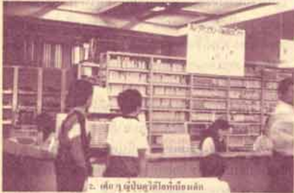
2. เด็ก ๆ ญี่ปุ่นดูวิดีโอที่คอมพิวเตอร์

การไปฝึกอบรมเรื่อง "การพัฒนาหนังสือและการสร้างนิสัยการอ่าน" ณ เมืองโตเกียว ประเทศญี่ปุ่น ทำให้ทราบปัญหาในเรื่องการอ่านของประเทศในแถบเอเชียและแปซิฟิก โดยเฉพาะการอ่านของคนญี่ปุ่น ซึ่งเป็นเรื่องที่ไม่ถึงว่าจะเป็นไปได้ว่าขณะนี้ คนญี่ปุ่นไม่รักการอ่าน