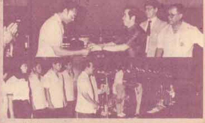
กีฬาประเพณี คณะกรรมการส่งเสริมกีฬาและนันทนาการ บุคลากร ม.ร. จัดการแข่งขันกีฬาประเพณี รามฯ-ABAC (วิทยาลัยอีสต์สมิธฮัมบริทจอร์จ) ครั้งที่ 4 เมื่อวันที่ 10 กุมภาพันธ์ 2532 โดยปีนี้มหาวิทยาลัยรามคำแหงเป็นเจ้าภาพ