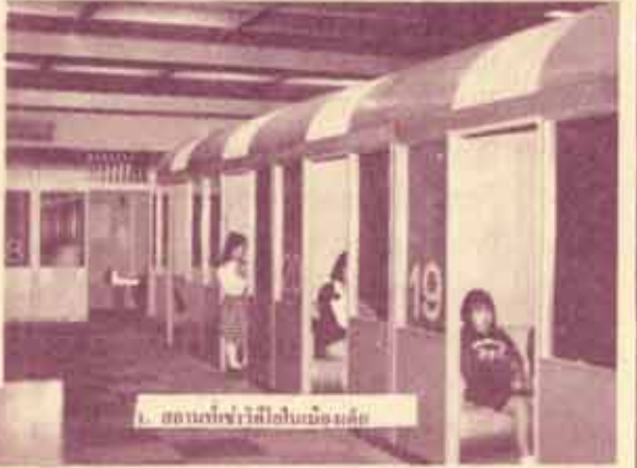
1. สถานที่เข้าใช้คอมพิวเตอร์

ผูกพัน ความจริงใจต่อกัน ทำให้คนมีจิตใจกระตือรือร้นมากขึ้น ทั้ง ๆ ที่ญี่ปุ่นมิได้ประสบปัญหาการ "ขาดวัสดุการอ่าน" หรือ "วัสดุการอ่านมีราคาแพง" เหมือนประเทศอื่นๆ เมื่อเทียบกับแล้ว ในประเทศญี่ปุ่นเองก็ทุกแห่ง มีหนังสือให้เลือกมากมาย แต่ปัญหาในขณะนี้คือ คนญี่ปุ่นไม่อ่านหนังสือหรือถ้าอ่านก็อ่านหนังสือที่ไม่มีคุณภาพ การอ่านของคนญี่ปุ่นปัจจุบันเป็นการอ่านเพื่อฆ่าเวลา หนังสือที่อ่านก็เป็นหนังสือการ์ตูนประเภทนินยาที่เรียกว่ามังง่า ซึ่งจำหน่ายขายดีมาก ยอดจำหน่ายสูงถึงสัปดาห์ละ 4-5 ล้านเล่ม วัยรุ่นญี่ปุ่นนิยมอ่านกันมาก อ่านกันบนรถไฟ อ่านแล้วทิ้งเลย