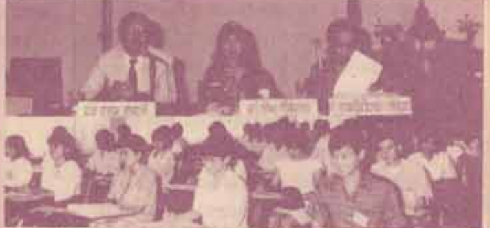
ฝึกอบรม คณะมนุษยศาสตร์ ม.ร. จัดโครงการฝึกอบรมบุคลากรและพัฒนาการพูด รุ่นที่ 2 สำหรับบัณฑิต นักศึกษา และผู้สนใจทั่วไป เมื่อวันที่ 9-12 กุมภาพันธ์ 2532 ณ ห้องประชุม ชั้น 2 คณะมนุษยศาสตร์