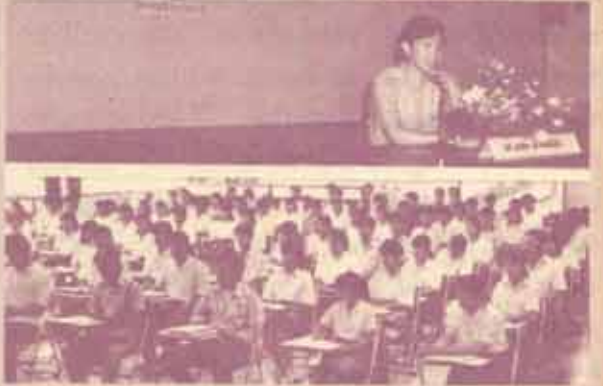
ปัจฉิมนิเทศ คณะวิทยาศาสตร์ ม.ร. จัดการปัจฉิมนิเทศนักศึกษา ประจำปีการศึกษา 2531 เมื่อวันที่ 10-12 กุมภาพันธ์ 2532 ณ ห้องประชุมระฆังทอง กุศลภคย์ และอุทยานแห่งชาติ จังหวัดกาญจนบุรีโดยมีรองศาสตราจารย์ ฆนท พรหมเมธี คณบดีคณะวิทยาศาสตร์เป็นประธาน

เกษตรกรรมปราจีนบุรี อ.อรัญประเทศ จ.ปราจีนบุรี ระหว่างวันที่ 20-22 กุมภาพันธ์ 2532..... ■ ส่วนในช่วง 3 วันดังกล่าว อีก 2 ชมรม คือ ชมรมปาฐกถาและโต้วาที อ.ส.ม.ร. ได้จัดสัมมนาและสรุปผลการทำงาน ณ หาดแม่รำพึง อ.บ้านแพ้ว จ.ระยอง ชมรมอาสาสมัคร อ.ส.ม.ร. ก็จัดสัมมนานักกีฬาและอบรมผู้ฝึกสอน ณ แคว้นริเวอร์ไซด์ อ.เมืองฯ จากกาญจนบุรี..... ■ ศูนย์นักศึกษานานาชาติไทย ม.ร. จัดอภิปรายเรื่อง "การศึกษาในมหาวิทยาลัยเปิด" และ "บทบาทของทหารกับการพัฒนาการเมืองไทย" ระหว่างวันที่ 21-23 กุมภาพันธ์ 2532 หอประชุมใหญ่ เอ.ดี. 1 ■ ปิดท้ายรอบวันมา จอมพล ป.เปรม ติณสูลานนท์ อดีตนายกรัฐมนตรี อดีตรองนายกรัฐมนตรี และอดีตรัฐมนตรีว่าการกระทรวงมหาดไทย ได้เดินทางมาเยือนมหาวิทยาลัยรามคำแหง เมื่อวันที่ 23 กุมภาพันธ์ 2532 ชมรมสหกรณ์ จัดอบรมเรื่อง "สหกรณ์กับประเทศไทย" ณ หอประชุม เอ.ดี. 1