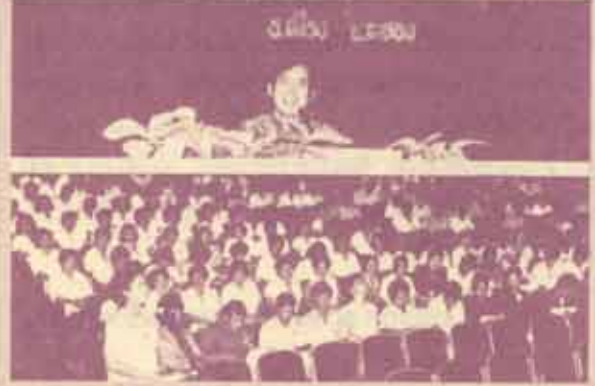
สัมมนา ศาสตราจารย์ ดร. ชรรณบุญ โสภารัตน์ อธิการบดีมหาวิทยาลัยรามคำแหง เป็นประธานเปิดการสัมมนาเรื่อง "แนวโน้มในการพัฒนาประสิทธิภาพการทำงาน" ของข้าราชการ-เจ้าหน้าที่กองอาคารสถานที่ รุ่นที่ 1 เมื่อวันที่ 9 กุมภาพันธ์ 2532 ณ หอประชุม เอ.ดี. 1