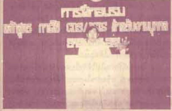
อบรมคอมพิวเตอร์ คณะกรรมการฝึกอบรม ม.ร. ร่วมกับสถาบันบริการคอมพิวเตอร์จัดการฝึกอบรม หลักสูตร "การใช้ CDS/ISIS สำหรับงานบุคคล" แก่เจ้าหน้าที่ของมหาวิทยาลัย เมื่อวันที่ 9-10 กุมภาพันธ์ 2532 ณ สถาบันบริการคอมพิวเตอร์ อาคาร สวป. ชั้น 4