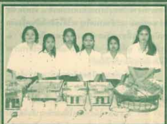
จัดเลี้ยง เมื่อวันที่ 11-12 มกราคม 2540 ณ อาคารหอประชุมพ่อขุนรามคำแหงมหาราช คณะเกษตร และนักศึกษามหาวิทยาลัยเกษตรศาสตร์ คณะศึกษาศาสตร์ มหาวิทยาลัยรามคำแหง ทำหน้าที่จัดการจัดเลี้ยงอาหารกลางวันและอาหารว่าง ในการประชุมวิชาการกีฬามหาวิทยาลัย ครั้งที่ 24 "หัวหมากเกมส์" ในหัวข้อเรื่อง "สวนสุขภาพเพื่อคนแก่กับการพัฒนากีฬา" มีผู้เข้าร่วมประชุมโดยประมาณ 200 ราย การจัดเลี้ยงครั้งนี้ได้รับความร่วมมือจากผู้เข้าร่วมประชุมในเรื่องความสะดวกและรสชาติของอาหาร นับเป็นความภาคภูมิใจของชาวเกษตรศาสตร์เป็นอย่างยิ่งที่ได้มีส่วนร่วมในกิจการงานของมหาวิทยาลัยรามคำแหง