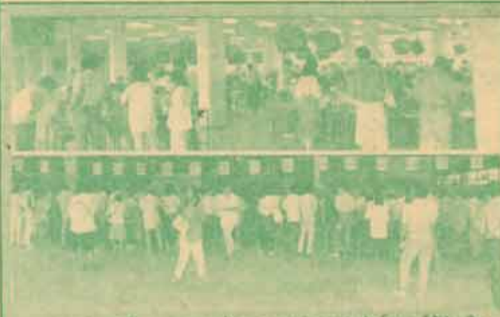
กษัตริย์ไทยมอบเข็มที่ระลึกแก่บัณฑิตจากมหาวิทยาลัยศรีนครินทรวิโรฒ โดยสมเด็จพระนางเจ้าสิริกิติ์ พระบรมราชินีนาถ เมื่อวันที่ 8-13 ธันวาคม ที่สนามกีฬาสมโภชเชียงใหม่ 2530

ความในเรื่องปัญหาระหว่างประเทศเรื่องใดเรื่องหนึ่งก็ได้ เป็นที่นาภูมิใจและยินดีเป็นอย่างยิ่งสำหรับผลการสอบข้อเขียนในปีนี้ ที่บัณฑิตของรวมค่าแห่งได้ทำชื่อเสียงให้กับมหาวิทยาลัย โดย