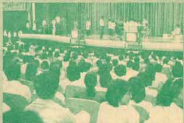
ต้อนรับปริญญา มหาวิทยาลัยรามคำแหงจัดการต้อนรับปริญญาแก่บัณฑิตรุ่นที่ 13 โดยพร้อมใจกัน 1 ระหว่างวันที่ 6-13 ธันวาคม 2530 ณ หอประชุม เฉ.ต. 1 และกำหนดการยิ่งใหญ่ ในวันที่ 15-23 ธันวาคม 2530 (เว้นวันที่ 19 ธ.ค. 30) ณ อาคารใหม่ สวนอัมพร