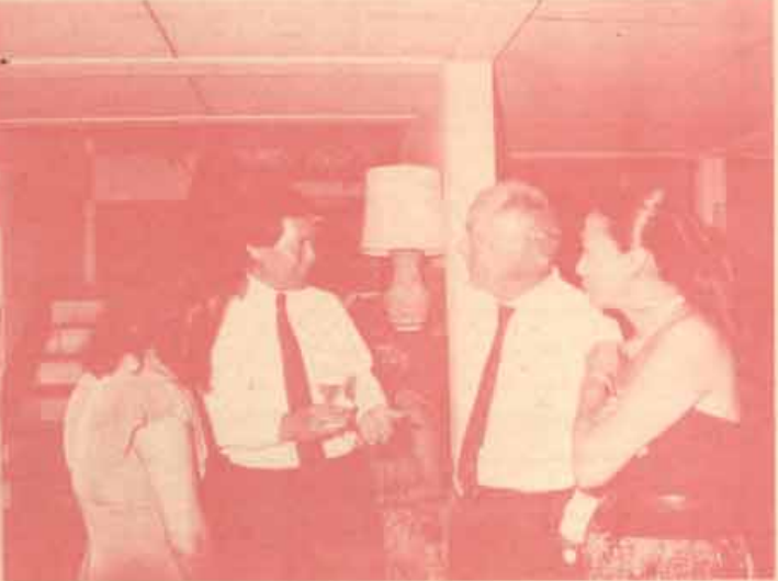
สถานที่พิมพ์ที่ภาษาฝรั่งเศสได้จัดงานเลี้ยงให้เป็นเกียรติแก่การครบรอบครบ ๒๐ ปีของคณะมนุษยศาสตร์ มหาวิทยาลัยรามคำแหง เมื่อ วันที่ ๑๖ สิงหาคม ๑๙๘๘

ชื่อสิ่งตีพิมพ์ของมหาวิทยาลัยทั้งในระดับประเทศและต่างประเทศ เป็นสิ่งที่ต้องใช้เวลาในการสร้าง แต่เมื่อชื่อสิ่งตีพิมพ์ระดับได้รับการยอมรับแล้วก็จะอยู่ในลักษณะของเครื่องหมายการค้าที่มั่นคงก็คือ การได้รับการรู้จักอย่างแพร่หลายได้รับการยอมรับโดยทั่วไป การติดค้อมีได้กล่าวถึงวิทยารวม คณะวิชาแต่ละสาขาตลอดไป ที่นักศึกษาจะยกย่องกล่าวถึง