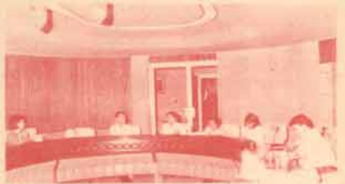
รายได้ที่ได้รับการสนับสนุนเหล่านี้ก็จะนำเข้ามาวิทยาลัยเพื่อลดค่าใช้จ่ายของ ม.ร.

เรื่องที่สอง ก็คือการพิจารณาหาผู้สนับสนุนค่าใช้จ่ายในการจัดพิมพ์ข่าวรามคำแหง ม.ร. 30 และค่าเช่าเวลาออกอากาศรายการโทรทัศน์การศึกษา ซึ่งอยู่ในระหว่างพิจารณา ยังไม่มีมติ โดยมอบให้หน่วยงานที่รับผิดชอบพิจารณารายละเอียดเสนอคณะกรรมการฯ เช่น มอบให้คณะกรรมการประชาสัมพันธ์พิจารณาเรื่องข่าวรามคำแหง มอบให้สำนักงานเทคโนโลยีการศึกษาพิจารณาเรื่องรายการโทรทัศน์การศึกษา ร่วมกับคณะกรรมการสื่อสารมวลชน ส่วน ม.ร. 30 ซึ่งเราเคยปรึกษานักศึกษาก็จะหาผู้สนับสนุนค่าใช้จ่ายในการจัดพิมพ์