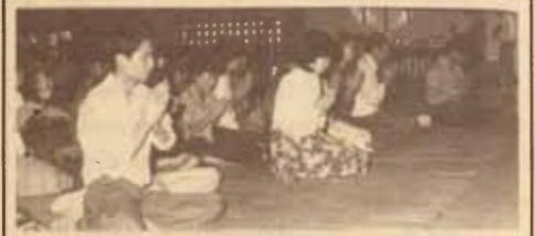
ทำบุญ ข้าราชการ เจ้าหน้าที่ งานบริการและสวัสดิการนักศึกษา กองกิจการนักศึกษา ม.ร. ทำบุญเลี้ยงพระเพื่อความ เป็นสิริมงคลของหน่วยงาน เมื่อวันที่ 3 ตุลาคม 2528 ณ GB 2