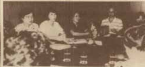
สัมมนาเชิงปฏิบัติ วิทยุและโทรทัศน์การศึกษา ม.ร. จัดสัมมนาเชิงปฏิบัติการเรื่อง "การผลิตรายการโทรทัศน์เพื่อการศึกษา" เมื่อวันที่ 3-6 ตุลาคม 2528 ณ โรงแรมชีวิวิ พทยา