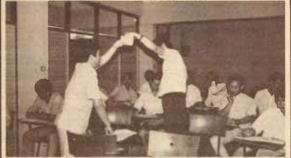
แบ่งสาย คณะกรรมการดำเนินการจัดการแข่งขันกีฬามหาวิทยาลัยแห่งประเทศไทย ครั้งที่ 13 ดำเนินการจับสลากเพื่อแบ่งสายการแข่งขันกีฬา ทั้ง 19 ประเภท โดยมีผู้แทนทั้ง 28 สถาบัน เข้าร่วม เมื่อวันที่ 4 ตุลาคม 2528 ณ อาคารเบกพล

สำหรับนักร้องนั้นได้เชิญนักร้องที่มีชื่อเสียงร่วมขับร้องทั้งฝ่ายชายและฝ่ายหญิง นักร้องชาย ได้แก่ สมศักดิ์ เทพพานนท์, ชรพงษ์ เสงี่ยมพันธ์, อโศก สุขศิริพรฤทธิ์, สุรพล