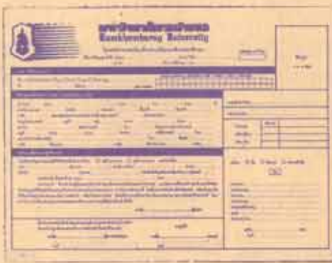
คู่มือการกรอกและการระบาย ม.ร. 25